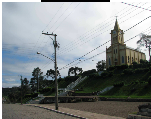
O Natal no Morro, tradicional festividade de Arvorezinha iniciará em 06/12 com o Coral de Fastro se apresentando.